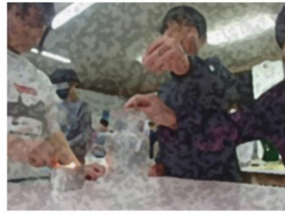
学習の様子。理科の実験、楽しく勉強！