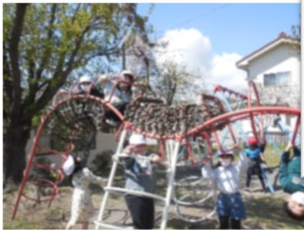
地域探検で校外へ(中央公園)！ 元気いっぱい！