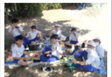
遠足予備日、外でのお弁当おいしいね！ (学校前庭で)