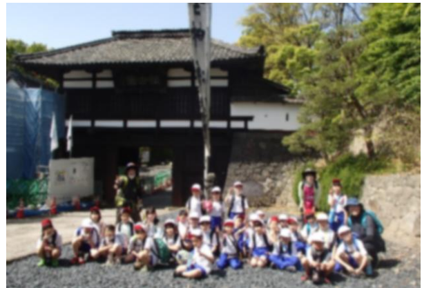
↑ 2年生:学校から歩いて「懐古園」へ。 帰りは小諸駅からJRに乗りました！