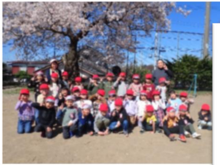
満開の桜の木の下で、全員集合！