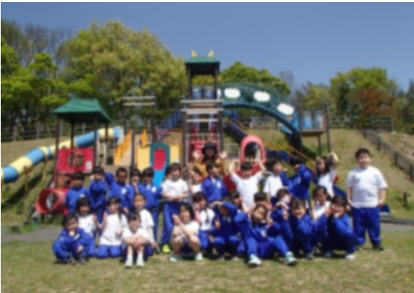
↑ 1年生:学校から歩いて「南城公園」へ。 遊具でたくさん遊びました！！