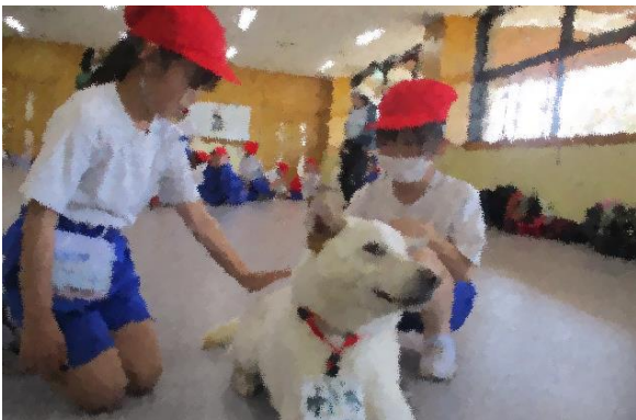
↑ 3年生:ハローアニマルへ。保護されている 動物達との触れ合いを楽しみました。