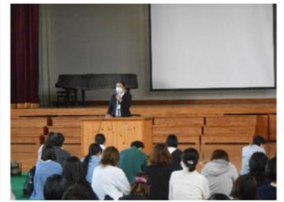
4年ぶりに参集してのPTA総会