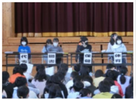
参集で児童総会を行いました！