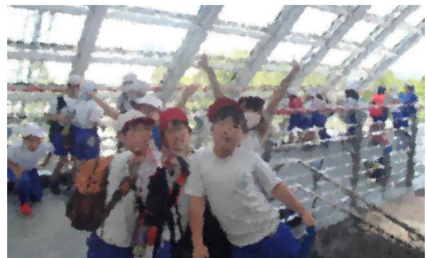
↑ 4年生:佐久平の市民交流広場へ。JRを利用して 行ってきました。交通網の勉強もしました。