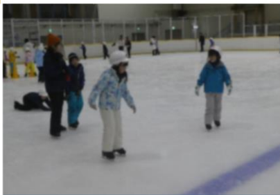
1・2年スケート教室(12/4)