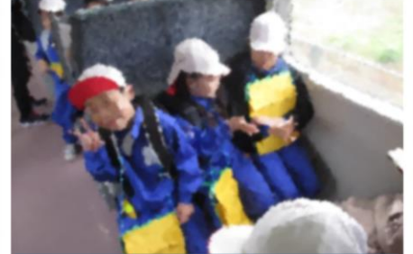
電車で乗って子ども未来館へ出発!(2年生・遠足)