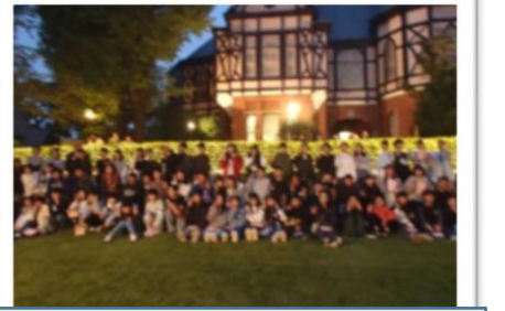
明治学院大学クリスマスツリー点灯式へ参加(6年生)