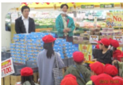
スーパーマーケットの秘密を探れ!(3年生・社会見学)