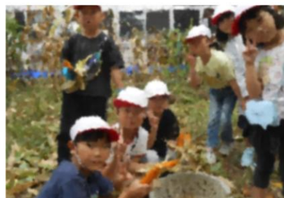
ポップコーンがたくさんとれました!(1年生)