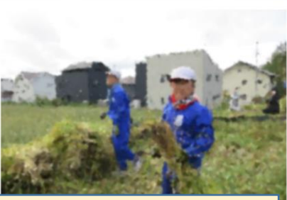
おいしいお米ができました!稲作体験(5年生)