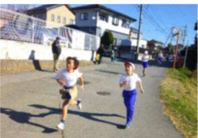
全力で最後まで頑張ったマラソン大会(11/22)