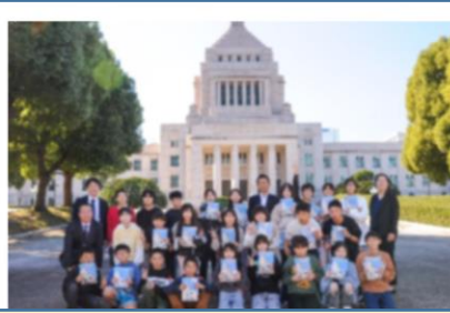
修学旅行で東京へ行ってきました!(6年生・11/6-7)