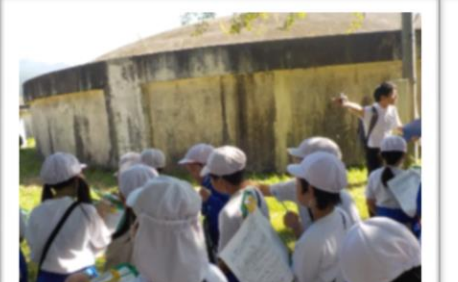
私たちの水はどこから?ゴミはどこへ?(4年生・社会見学)